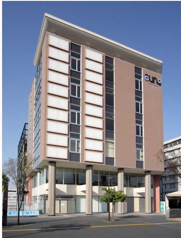
『aune KOHOKU』(あうね港北) センター南駅 正面

『aune KOHOKU』は、分譲マンションや商業施設などの開発を手がける不動産デベロッパーであるジョイント・コーポレーションが展開する商業施設の新ブランド「aune」(あうね)の第2弾です。3月29日に海浜幕張駅にオープンした『aune MAKUHARI』(あうね幕張)に続く商業施設で、「aune」ブランドのコンセプトに基づいた施設開発とサービス提供により、不動産価値向上と地域活性化を図ります。